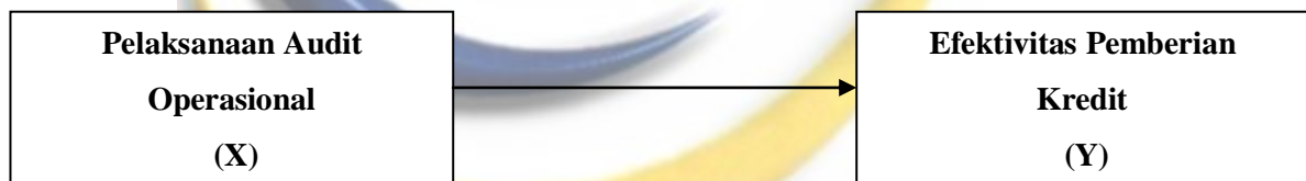
Gambar 2.2 Kerangka Pemikiran