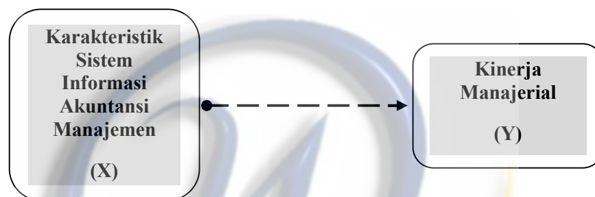
Gambar 2.3 Model Kerangka Pemikiran

meningkatkan kualitas keputusan yang akan diambil. Dengan demikian ketersediaan karakteristik sistem informasi akuntansi manajemen (SIAM), memungkinkan manajer untuk mengambil keputusan secara tepat dan cepat yang pada akhirnya dapat meningkatkan kinerja manajerial.