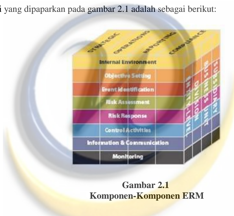
Gambar 2.1 Komponen-Komponen ERM

kategori tujuan (kolom vertical), komponen manajemen risiko (baris horizontal), dan struktur organisasi suatu entitas (sisi samping kubus). Matrik tiga dimensi ini menggambarkan kemampuan untuk memfokuskan manajemen risiko secara keseluruhan organisasi, atau berdasarkan kategori tujuan, komponen, dan struktur organisasi yang ada didalam suatu entitas. Berikut bentuk kubus atau matrik tiga dimensi yang dipaparkan pada gambar 2.1 adalah sebagai berikut: