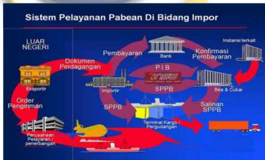
Gambar 2.2 Prosedur Impor

Prosedur umum proses impor di Indonesia melalui INSW (Indonesia National Single Window) adalah sebagai berikut :