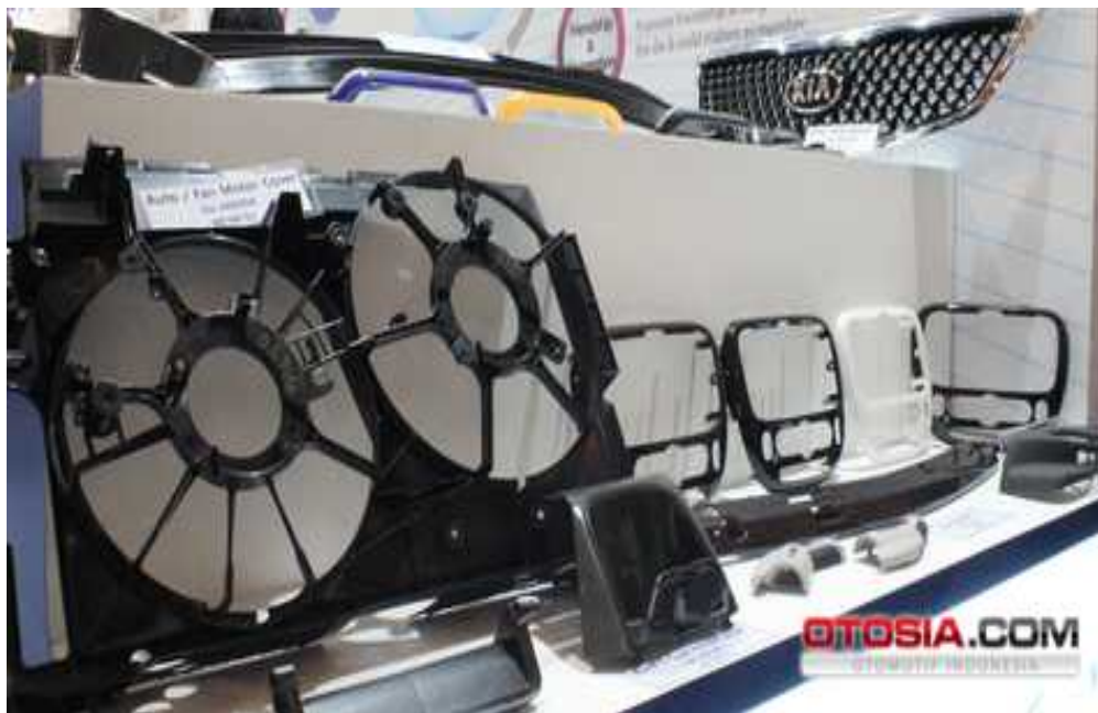
Gambar 1.2 Produk Aksesori dan Part untuk ATPM

rata sekitar 60 persen. Kecuali untuk kendaraan jenis low cost and green car (LCGC) telah mencapai TKDN sebanyak 80-90 persen. Sumber : ( https://www.liputan6.com/bisnis/read/2852007/menperin-ingin-komponen-lokal-pada-industri-otomotif-capai-90,2019 )