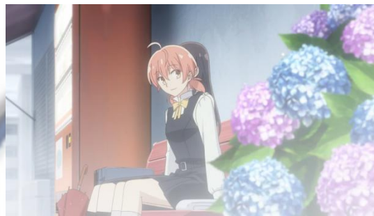
Gambar 4.27 Ajisai Ungu dan Biru