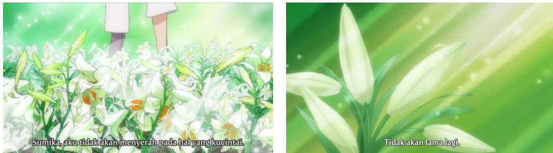
Gambar 4.7 dan 4.8 Shirayuri