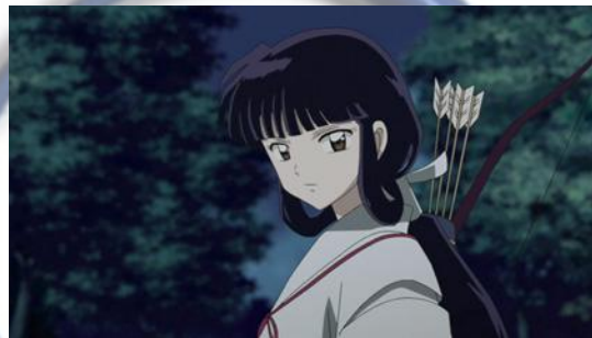
Gambar 4.31 Kikyo

Kikyo merupakan salah satu tokoh dari anime yang berjudul Inuyasha . Ia adalah seorang miko yang bertanggungjawab untuk menjaga shikon no tama .