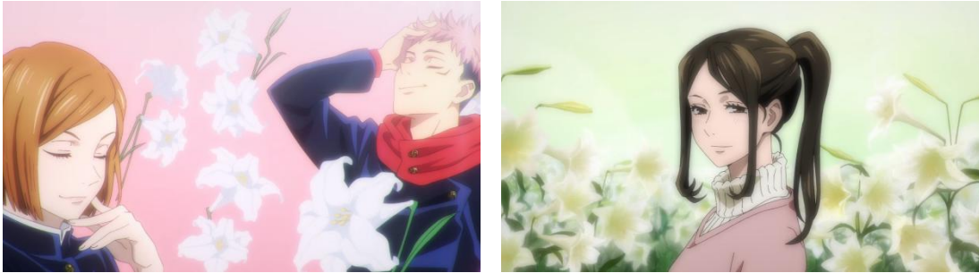
Gambar 4.3 dan 4.4 Shirayuri

Dalam anime Ouran Koukou Host Club pada episode 8, para siswi perwakilan Zuka club dari sekolah khusus perempuan Lobelia yaitu Amakusa Benio, Maihara Chizuru dan Tsuwabuki Hinako datang ke SMA Ouran untuk mendeklarasikan bahwa mereka akan ‘menghancurkan’ host club Ouran. Masing-masing dari mereka memperkenalkan diri sambil bernyanyi dan memegang bunga shirayuri . Kemudian pada episode 19 menit 04:59 adegan tersebut menunjukkan Haruhi yang sudah selesai mengganti pakaiannya menjadi seragam Lobelia di ruang ganti, ditemani oleh bunga shirayuri sebagai background .