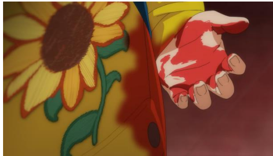
Gambar 4.28 Bunga Matahari

Makna Denotatif: Bunga himawari adalah tumbuhan yang memiliki kepala bunga berukuran besar, kelopak berwarna kuning cerah yang tersusun rapi dan rapat, batang yang tegak dan tinggi, serta daun lonjong bergerigi.