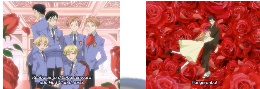
Gambar 4.11 dan 4.12 Mawar Merah

menjadi background dari setiap adegan terutama adegan yang romantis, seperti apa yang ditampilkan pada episode 4 menit 07:50.