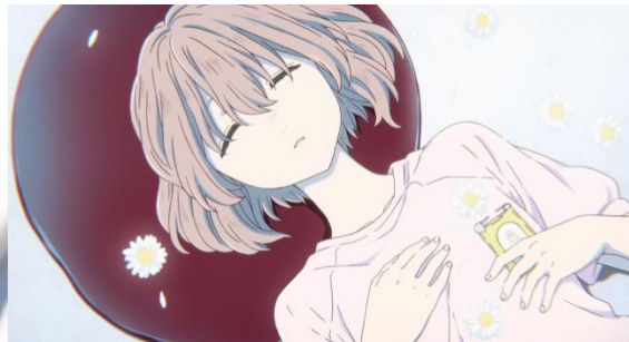
Gambar 4.20, 4.21 dan 4.22 Hinagiku (Sumber: Koe no Katachi )

Makna Denotatif: Bunga hinagiku merupakan bunga berukuran kecil yang memiliki ciri-ciri kelopak rapat dan tersusun rapi serta mahkota bunga berwarna kuning. Bunga hinagiku tumbuh dengan beragam jenis warna, namun umumnya kelopak bunga hinagiku berwarna putih.