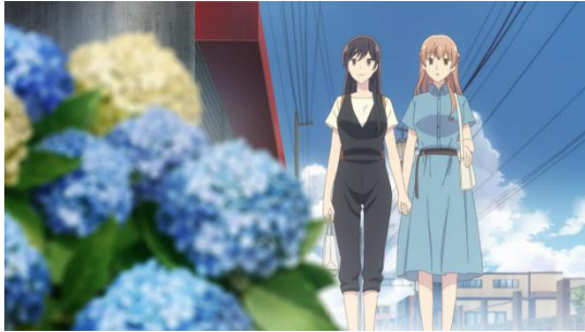
Gambar 4.25 Ajisai Biru dan Putih