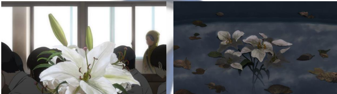
Gambar 4.1 dan 4.2 Shirayuri

Bunga shirayuri kedua muncul dalam episode 11 menit 14:51, saat dedaunan dan bunga shirayuri yang sebagian mengambang di atas genangan air. Adegan ini ditampilkan setelah Azusa, istri dari Acca yang meninggal akibat terserum oleh alat pengering rambut yang dilempar Frill saat ia sedang mandi di bath tub .