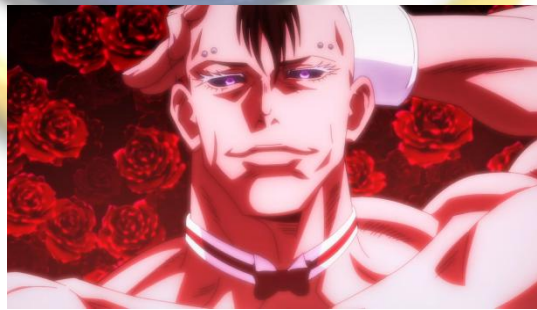
Gambar 4.10 Akaibara

Pada anime Jujutsu Kaisen episode 23 menit 03:36 ada sebuah adegan menampilkan roh kutukan berwujud seorang pria yang eksentrik bernama Eso dan background berupa kumpulan bunga akaibara .