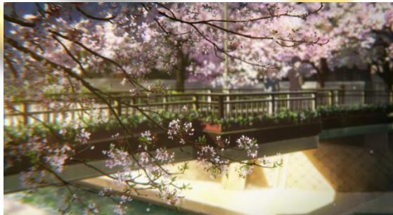
Gambar 4.23 Sakura

Film Koe no Katachi pada menit 42:31 menampilkan adegan Shouya dan Shouko memberi makan ikan yang hidup di sungai bawa jembatan dengan roti, kemudian berpindah ke pohon bunga sakura yang ada di sekitar jembatan. Pada opening pertama anime Inuyasha detik 00:57, adegan tersebut menunjukkan Inuyasha yang sedang berjalan di bawah pohon bunga sakura yang kelopaknya berguguran.