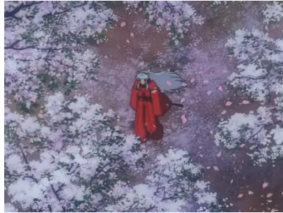
Gambar 4.24 Sakura (Sumber: Inuyasha )

Makna Denotatif: Bunga sakura merupakan bunga yang tumbuh dari pohon ceri Jepang dan hanya mekar saat musim semi. Ciri khas dari bunga ini adalah berwarna putih dengan sedikit warna merah jambu serta kelopak bunganya yang berguguran.