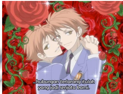
Gambar 4.14 Mawar Merah

Selanjutnya, pada episode 5 menit 03:01 terdapat sebuah adegan di mana tokoh anak kembar yang bernama Hikaru dan Kaoru saling berpelukan, dikelilingi oleh bunga akaibara . Adegan ini mengindikasikan bayangan dari hubungan pria yang menyukai sesama jenis yang berlawanan dengan genre yuri yaitu yaoi atau boys love .