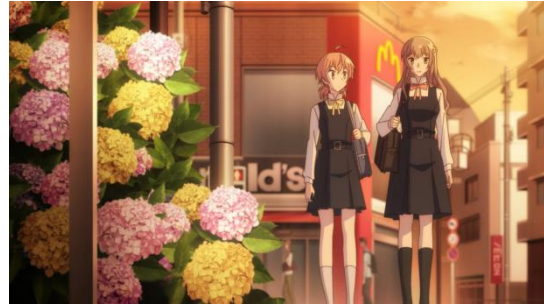
Gambar 4.26 Ajisai Putih dan Merah Jambu