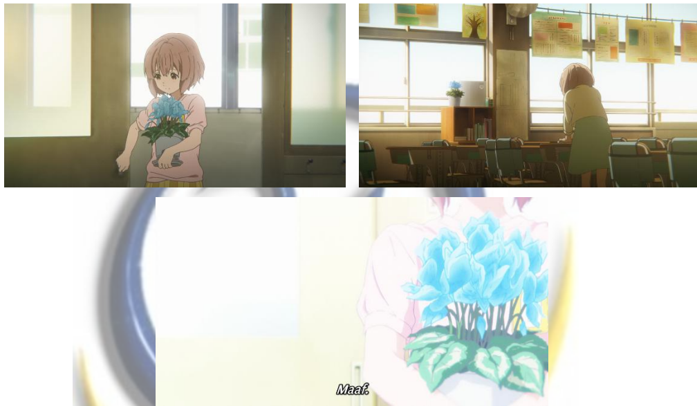
Gambar 4.17, 4.18 dan 4.19 Kagaribibana Biru yang ditampilkan Satu Frame dengan Shouko (Sumber: Koe no Katachi )

terakhir muncul pada jam 01:39:47 saat Shouya ketika ia memegang tangan Shouko agar ia tidak jatuh karena mencoba bunuh diri dan ia mengingat kembali saat masa-masa merundung Shouko dulu. Adegan kilas balik tersebut menunjukkan Shouko yang membawa pot bunga kagaribibana biru.