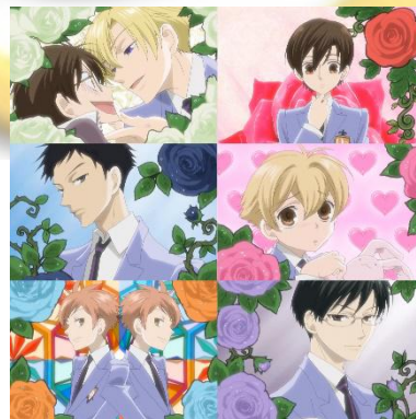
Gambar 4.13 Representasi Bunga Mawar dari Setiap Karakter

Bunga mawar adalah unsur penting dalam anime ini, sehingga setiap episode mengandung bunga mawar di dalamnya. Setiap tokoh utama memiliki bunga mawarnya sendiri dan masing-masing maknanya berbeda, menyesuaikan dengan karakter sang tokoh. Makna dari bunga mawar yang digunakan cenderung mengacu pada bahasa bunga Victoria dibanding hanakotoba .