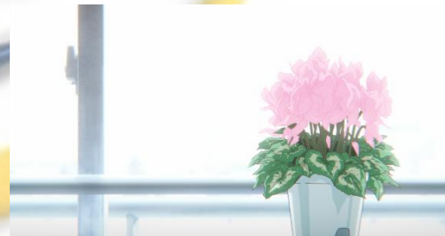
Gambar 4.16 Kagaribibana Merah Jambu