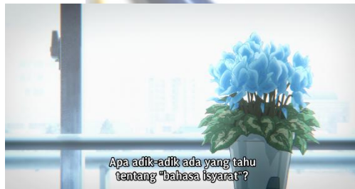
Gambar 4.15 Kagaribibana Biru

Bunga ini ditampilkan dalam salah satu film anime yang berjudul Koe no Katachi . Terdapat dua bunga kagaribibana di dalam anime ini, yaitu bunga kagaribibana biru dan bunga kagaribibana merah jambu. Bunga kagaribibana biru pertama kali muncul pada menit 10:29, ketika siswa kelas 6-2 akan memulai kelas tuna-rungu mempelajari bahasa isyarat. Kemudian bunga kagaribibana merah jambu dapat dilihat pada jam 01:47:55, saat adegan di dalam mimpi Shouko yang menampilkan masa-masa ketika ia masih di sekolah dasar sebagai siswa baru.