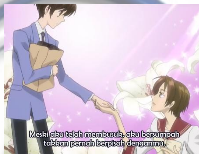
Gambar 4.9 Shirayuri

Makna Denotatif: Bunga shirayuri memiliki karakteristik berupa benang sari yang mencolok, kebanyakan berbentuk seperti mangkok atau terompet dengan enam kelopak berwarna putih, batang yang lurus dan daun berwarna hijau yang panjang.