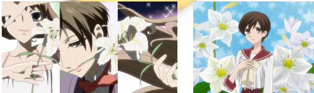
Gambar 4.5 dan 4.6 Shirayuri

Dalam anime Ouran Koukou Host Club pada episode 8, para siswi perwakilan Zuka club dari sekolah khusus perempuan Lobelia yaitu Amakusa Benio, Maihara Chizuru dan Tsuwabuki Hinako datang ke SMA Ouran untuk mendeklarasikan bahwa mereka akan ‘menghancurkan’ host club Ouran. Masing-masing dari mereka memperkenalkan diri sambil bernyanyi dan memegang bunga shirayuri . Kemudian pada episode 19 menit 04:59 adegan tersebut menunjukkan Haruhi yang sudah selesai mengganti pakaiannya menjadi seragam Lobelia di ruang ganti, ditemani oleh bunga shirayuri sebagai background .