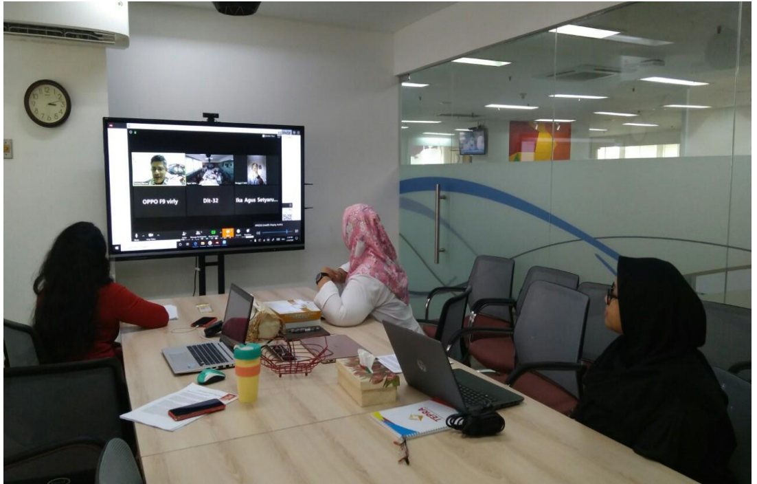
Gambar 3.7 Rapat bersama dengan salah satu yayasan dari India