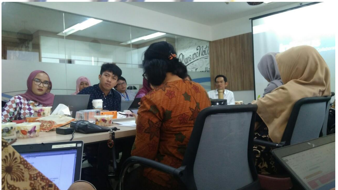
Gambar 3.8 penulis menjadi notulensi dalam rapat