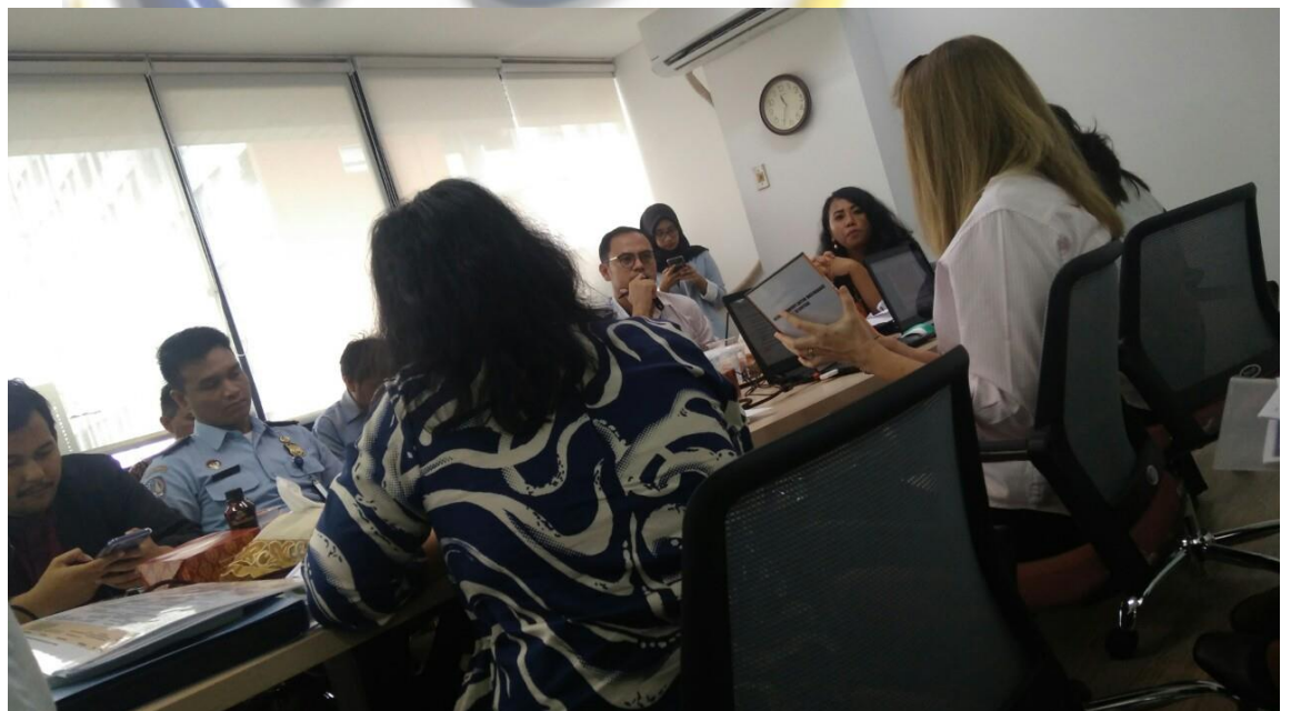
Gambar 3.6 Rapat bersama dengan perwakilan dari Yayasan TKA CM