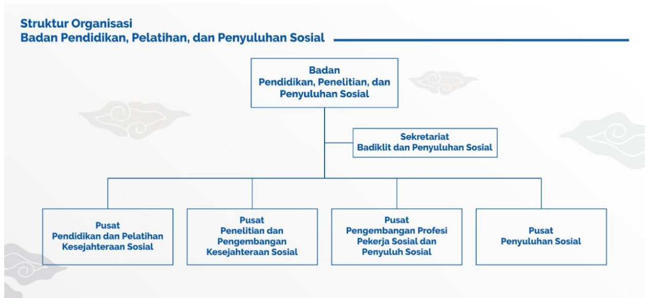
Gambar 3.1 Struktur Organisasi Kementerian Sosial Republik Indonesia