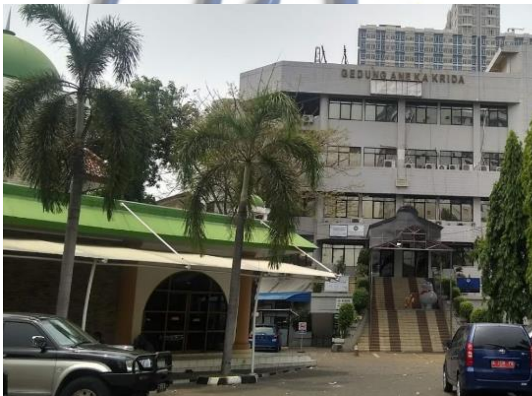
Gambar 3.4 Gedung Aneka Krida