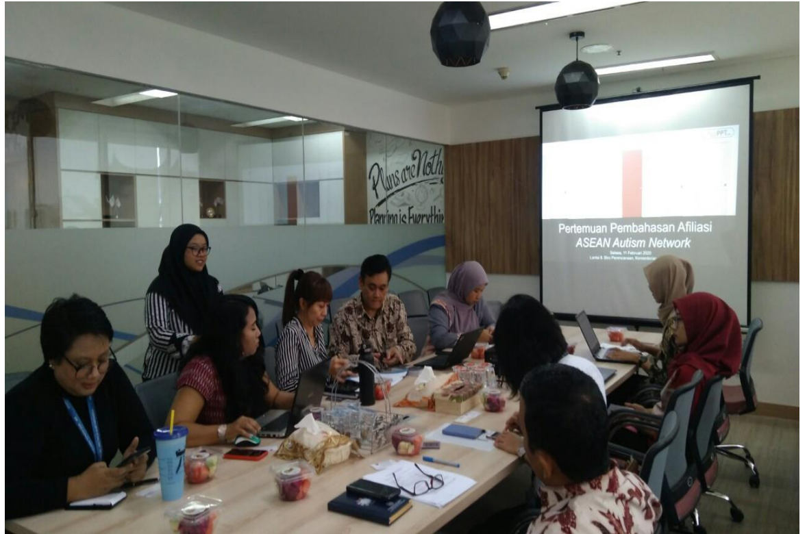
Gambar 3.5 Rapat bersama perwakilan dari A.A.N ( Asean Autism Network )