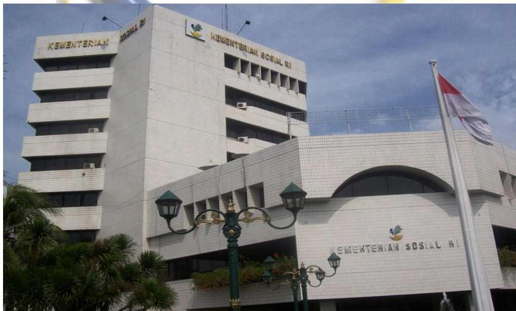
Gambar 3.2 Gedung Kementerian Sosial RI

Lokasi Kementerian Sosial Republik Indonesia beralamat di Jalan Salemba Raya No. 28, Rw.06, Kenari, Kec. Senen, Kota Jakarta Pusat, Daerah Khusus Ibukota Jakarta dengan Kode Pos 10430. Kemetrian Sosial memiliki total 3 gedung, yaitu Gedung Mensa, Gedung Aneka Bhakti 1, dan Gedung Aneka Krida Kementerian Sosial