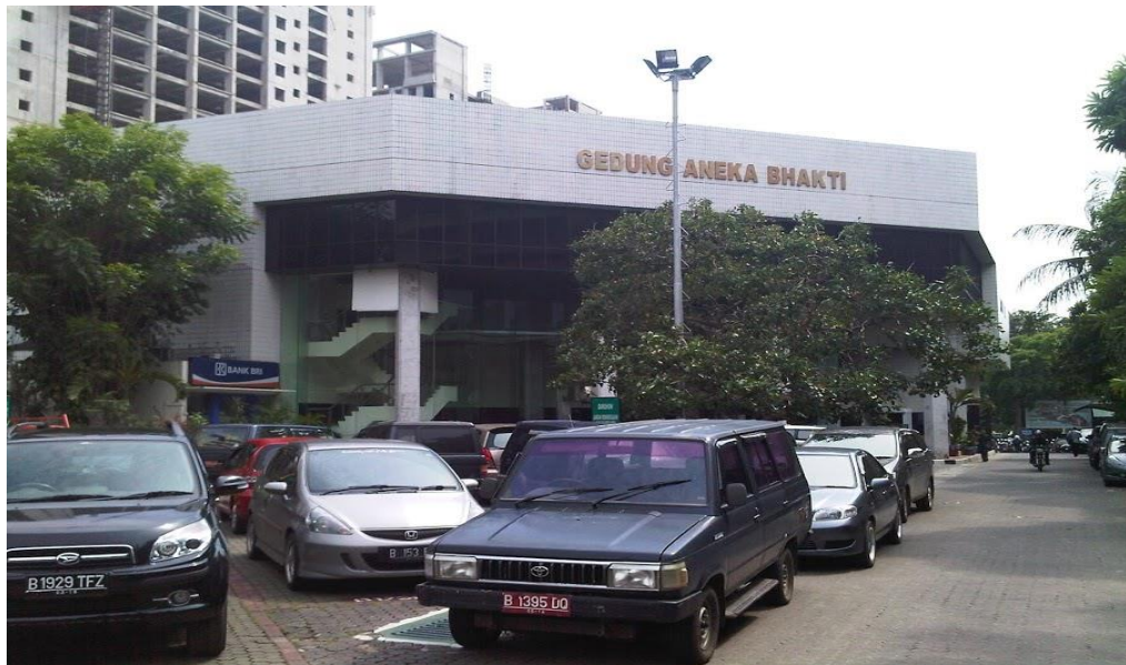
Gambar 3.3 Gedung Aneka Bhakti