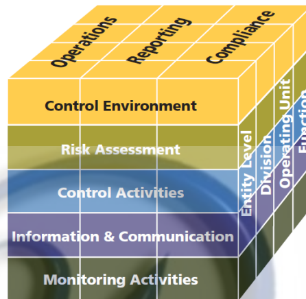
Gambar 2.2 Lima Komponen Pengendalian Internal

Ada lima komponen dalam pengendalian internal menurut COSO (2013:4), seperti yang digambarkan berikut ini:.