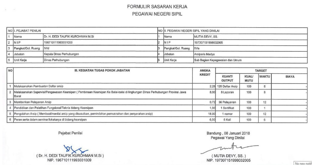
Tabel 4.1 Formulir Sasaran Kinerja Pegawai Negeri Sipil