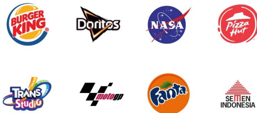
Gambar 2.5 Combination