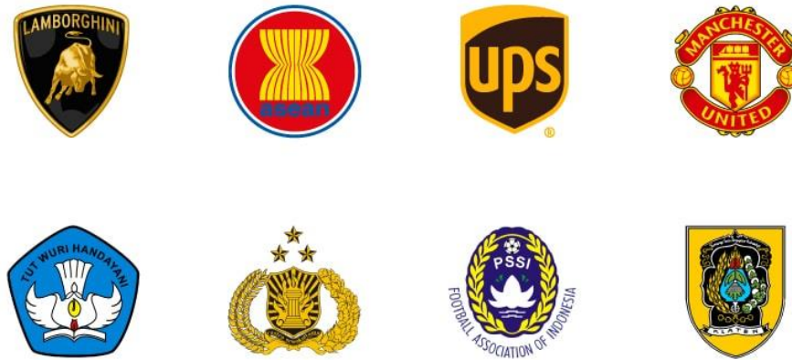
Gambar 2. 6 Emblem Logo

Logo emblem terdiri dari huruf yang berada di dalam simbol/ ikon, lencana, segel atau inti dari lambang tersebut. Logo ini cenderung memiliki tampilan tradisional namun dapat membuat kesan mencolok. Penggunaannya secara umum lebih sering menjadi pilihan utama bagi banyak sekolah, instansi pemerintah, organisasi maupun perusahaan dengan konsep klasik (Grapiku, 2020, Maret 17).