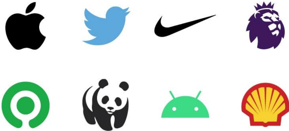
Jenis logo Symbol merupakan logo berbasis gambar yang biasa disebut juga Gambar 2. 3 Logo Symbol

dengan istilah ikon. Simbol ini sangat melekat pada sebuah brand, dengan begitu nama atau identitas perusahaan atau organisasi dapat dikenali walau hanya dengan melihat simbolnya saja. Tipe logo ini bisa dibilang cukup rumit ketika digunakan oleh perusahaan baru atau yang belum memiliki pengakuan merek yang kuat. Karena apabila logo jenis lain bisa dengan jelas mencitrakan merek dengan mencantumkan nama maupun inisial merek pada logo, pemakaian logo simbol atau ikon ini hanya bisa mengandalkan gambar ikonik saja.