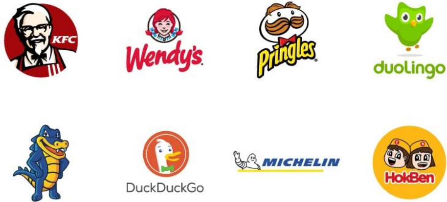
Gambar 2. 4 Logo Maskot

Logo maskot adalah logo yang melibatkan karakter bergambar. Maskot ini juga bisa dianggap sebagai duta bagi sebuah brand. Ciri khasnya seringkali berwujud kartun, penuh warna, dan selalu tampak memberikan gambaran menyenangkan.