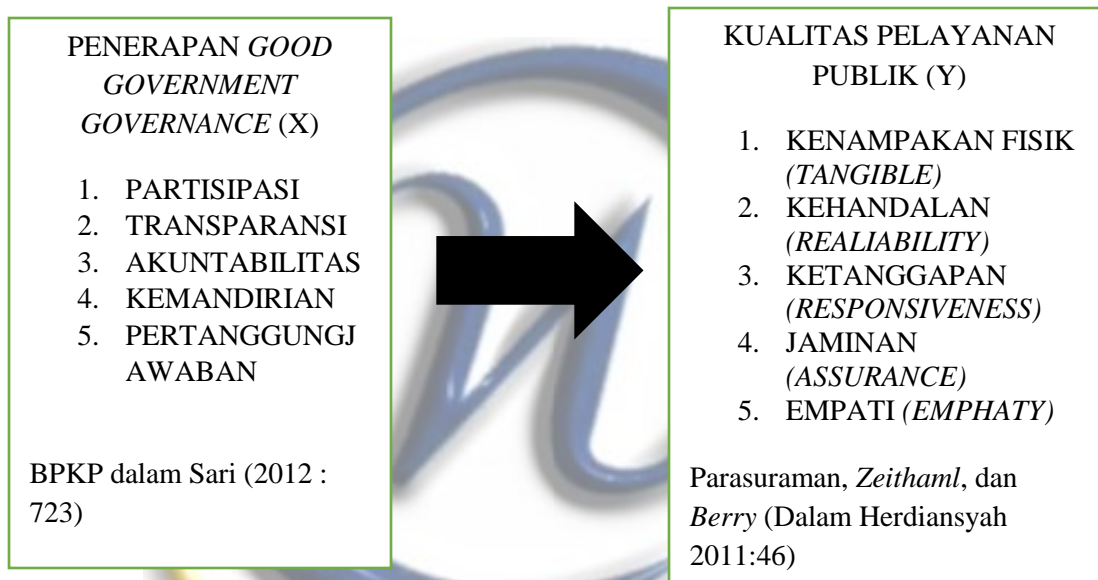
Gambar 2.1 Hubungan Variabel X dan Y

Model Paradigma Pemikiran yang dapat digambarkan adalah sebagai berikut :