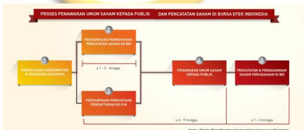
Gambar 2.1 Proses Penawaran Umum Saham Kepada Publik dan Pencatatan di Bursa Efek Indonesia

Kegiatan yang dilakukan dalam proses penawaran umum berdasarkan (idx, 2016) meliputi :