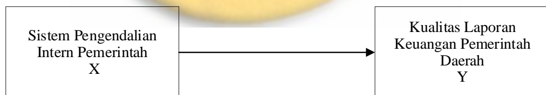
Gambar 2.2 Paradigma Penelitian

Berdasarkan penjelasan dari kerangka pemikiran diatas, maka dapat digambarkan dengan paradigma penelitian sebagai berikut: