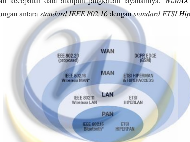
Gambar 2.1. Standard teknis jaringan tanpa kabel ( wireless ) [siy1]

WiMAX (Worldwide Interoperability for Microwave Access) didefinisikan sebagai sebuah sertifikasi untuk produk-produk yang cocok dan sesuai dengan standard IEEE 802.16 . WiMAX merupakan teknologi broadband nirkabel yang menyediakan hubungan pita lebar dengan jangkauan yang jauh. WiMAX merupakan evolusi dari teknologi BWA sebelumnya yang memiliki keterbatasan baik dalam kecepatan data ataupun jangkauan layanannya. WiMAX merupakan penggabungan antara standard IEEE 802.16 dengan standard ETSI HiperMAN .