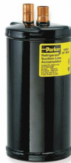
Gambar 2.7 Accumulator

Alat ini dipasang setelah evaporator dan berfungsi untuk menampung refrigeran yang keluar dari evaporator sehingga pada saat masuk kompresor, fasa refrigeran benar-benar dalam keadaan uap. Dengan demikian, kompresor terhindar dari kerusakan akibat refrigeran berfasa cair. Refrigeran gas dari Evaporator yg bercampur dengan refrigeran cair dan juga pelumas yg terbawa sirkulasi dalam sistem masuk ke inlet Accumulator . Pada saat masuk ke Accumulator kecepatan aliran refrigeran turun dengan tiba2 sehingga pelumas dan refrigeran cair yg berat jenisnya lebih besar dari refrigeran dalam bentuk gas akan turun ke bagian bawah Accumulator . Sementara refrigeran dalam bentuk gas akan langsung masuk ke bagian pipa outlet Accumulator .