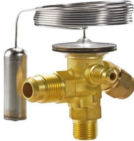
Gambar 2.5 Katup Ekspansi Termostatik