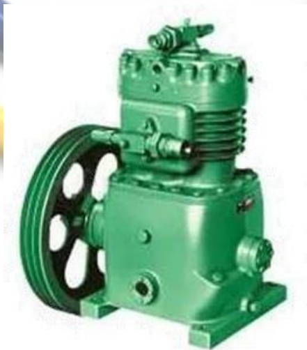
Gambar 2.1 Kompresor Open-type