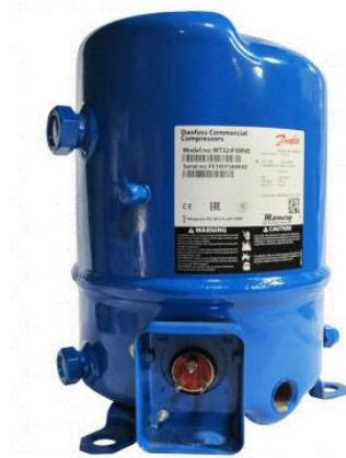
Gambar 2.2 Kompresor Hermetic