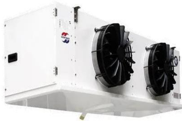
Gambar 2.6 Evaporator Bersirip (finned)