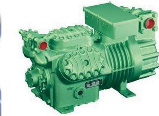
Gambar 2.3 Kompresor SemiHermetic

Jenis kompresor berdasarkan cara kerjanya kompresor dibagi menjadi lima, yaitu: