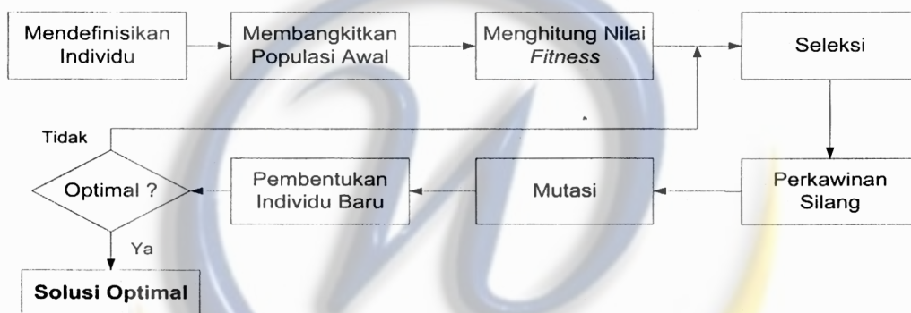
Gambar 1 Langkah-Langkah Proses Genetic Algorithm