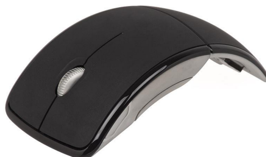
Gambar 2 Mouse ergonomik - Microsoft Arc wireless mouse

Masih banyak kasus gangguan kesehatan yang didapati para pekerja kantoran dewasa ini dikarenakan penggunaan perangkat komputer yang terlalu lama yang tidak tepat, misalnya: