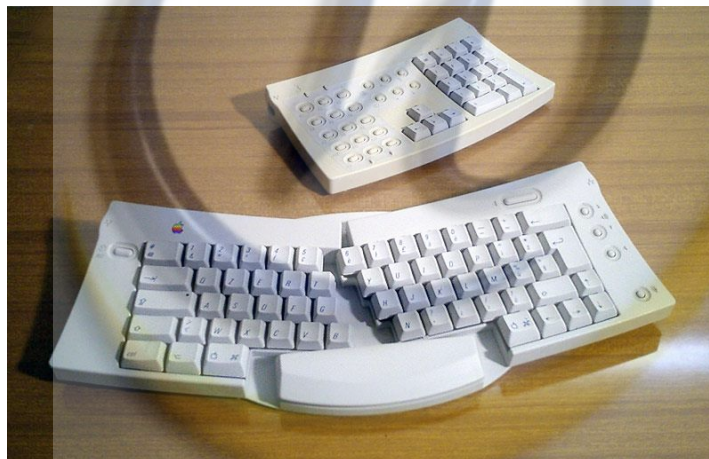
Gambar 1 Keyboard ergonomik – Apple Adjustable Keyboard

Pernyataan Bernardino memang benar, berbagai masalah seperti Cumulative Trauma Disorders (CTD) atau Repetitive Strain Injuries (RSI) diderita karena penggunaan perangkat komputer dalam waktu lama yang memunculkan ketidaknyamanan yang terakumulasi dan berulang atau repetitif [1][9][10].