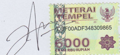
Naufal Andri Gumilar

Hasil pekerjaan saya dan seluruh ide, pendapat, atau materi dari sumber lain telah dikutip dengan cara penulisan referensi yang sesuai. Pernyataan ini saya buat dengan sebenar-benarnya dan jika pernyataan ini tidak sesuai dengan kenyataan, maka saya bersedia menanggung sanksi yang akan dikenakan kepada saya termasuk pencabutan gelar Sarjana Teknik yang nanti saya dapatkan.