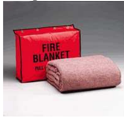
Gambar 2.5 Gambar Fire Blanket