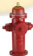
Gambar 2.3 Gambar Hydrant