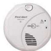
Gambar 2.4 Gambar Smoke Alarm