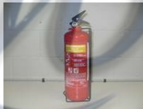
Gambar 2.2 Gambar Fire Extingusihed