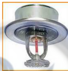
Gambar 2.1 Gambar Splinker