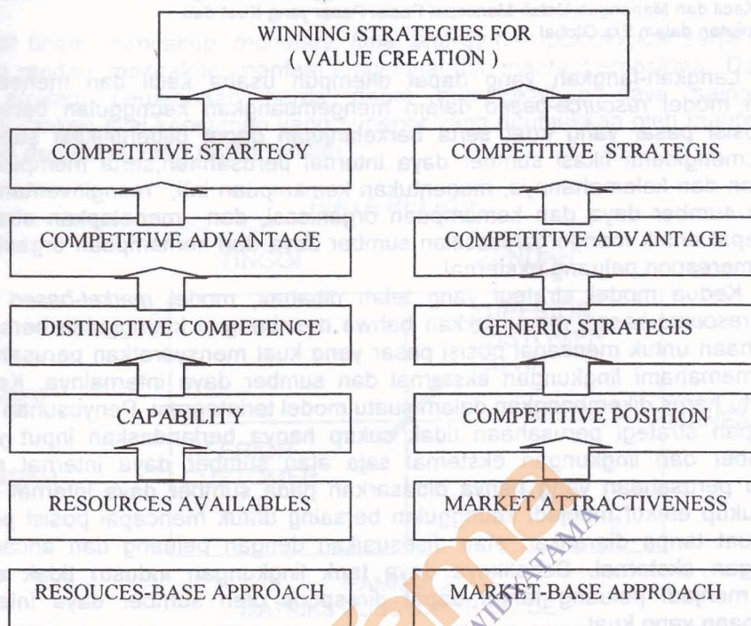
GAMBAR 1 DASAR DAN ARAH MODEL RESOURCE-BASE DAN MODEL MARKET-BASE